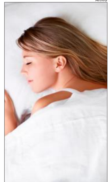
Descansar bé redueix l'ansietat

Dormir boca amunt és una altra possibilitat i «també és una bona opció» segons Salvans. En aquest cas permet que el cap, el coll i la columna vertebral mantinguin una posició neutral, la qual cosa la converteix en una excel·lent opció per qualsevol persona que pateixi dolor en aquestes àrees del cos. «S'hi pot afegir,